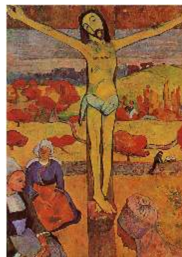
P. Gauguin, Cristo Giallo 1889

La redazione di MappaMondoX Augura Buona Pasqua