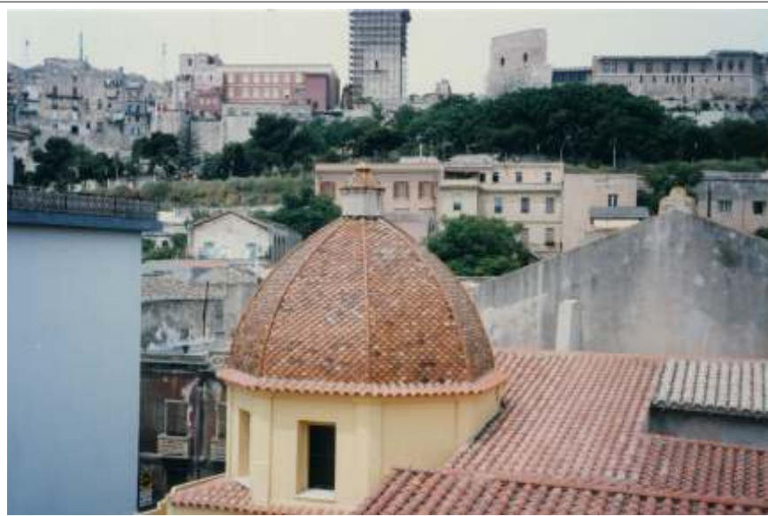
San Mauro: nel cuore della città

Da questo numero, dedicheremo le pagine centrali alle attività delle singole sedi, ospitando i contributi dei ragazzi e dei loro familiari, dei responsabili, volontari e collaboratori.