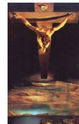
S. Dali, The Christ of Saint John on the cross