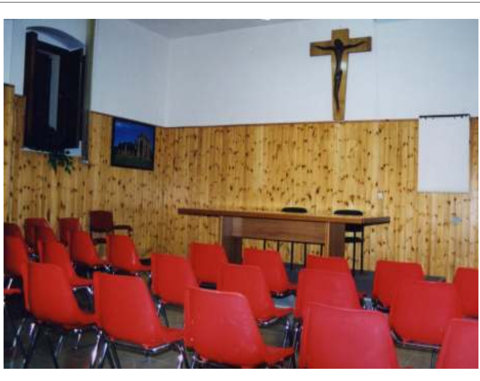
Uno scorcio del Centro di accoglienza “Sant'Antonio abate”

- preparazione, con colloqui individuali,