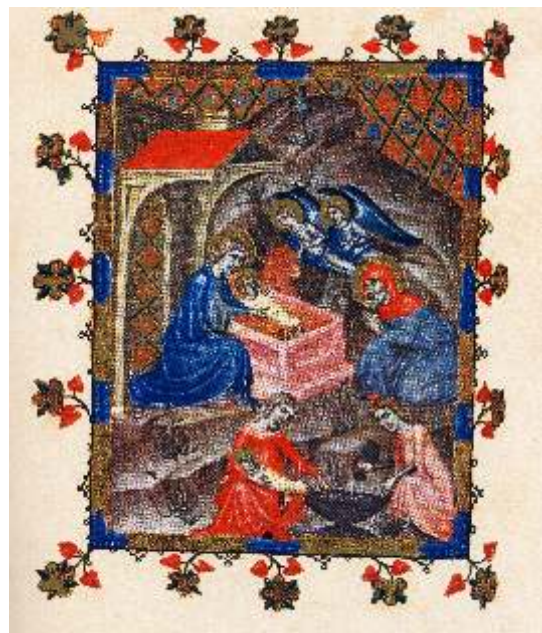
Natività di Gesù, Codice Miniato XII sec., Biblioteca Marciana, Venezia

La redazione di MappaMondoX augura a tutti Buon Natale e Felice Anno 2003