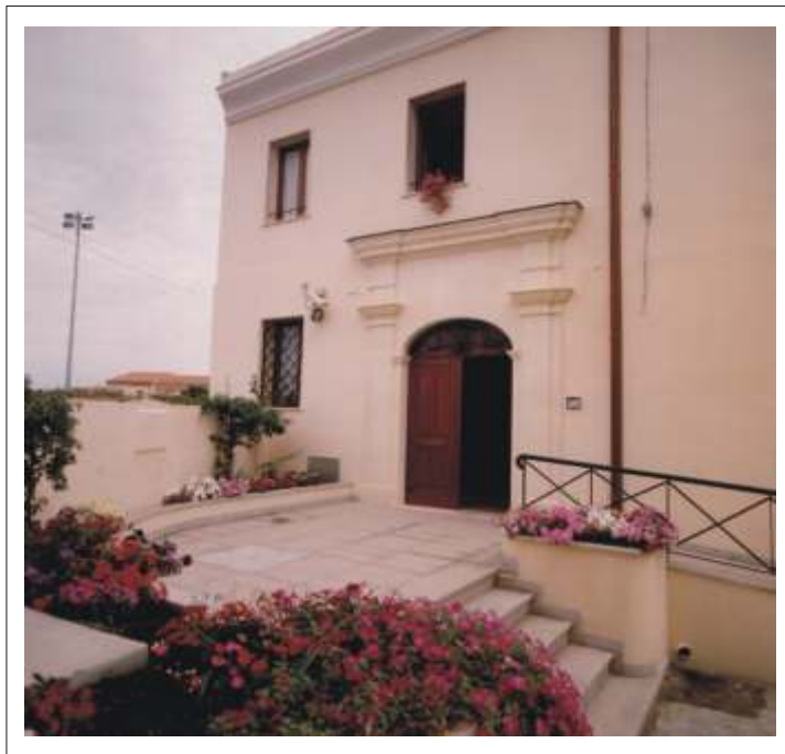
La Casa Famiglia "Sant'Antonio abate" per i malati di Aids

Non sono rare le gite che coinvolgono, quando è possibile, l'intero gruppo. Talvolta associati ai ragazzi della vicina