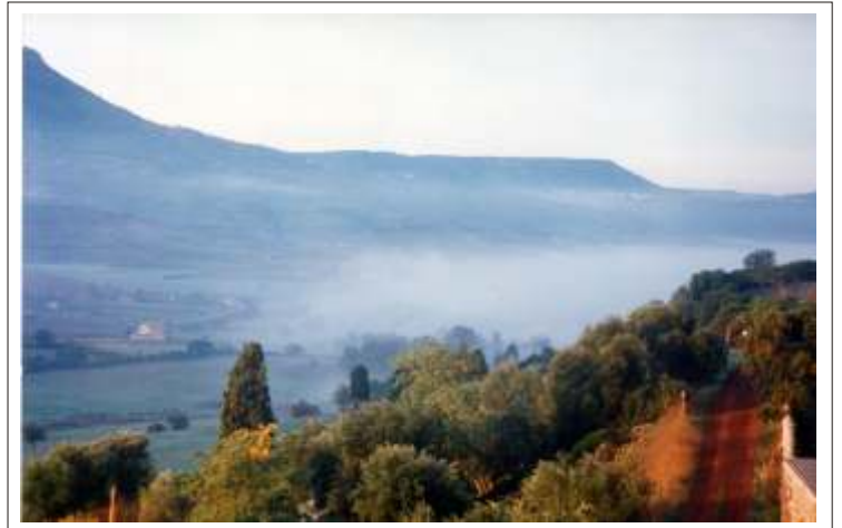
Le colline di S'Aspru, a pochissimi chilometri da Siligo