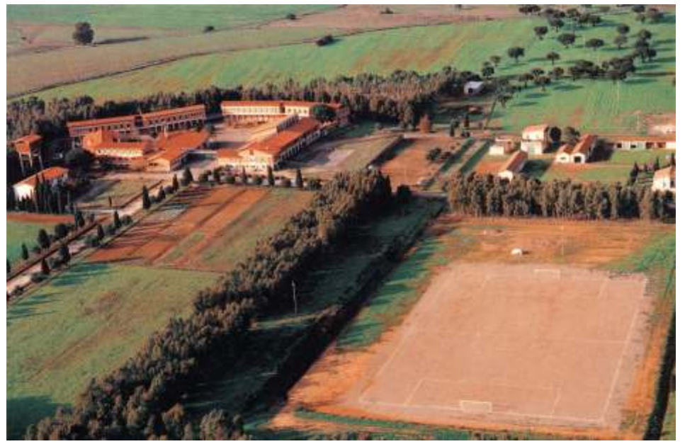
La comunità di Campu 'e Luas, a Macchiareddu, in agro di Uta

Quest'ultimo, già dal 1991 dopo l'avvio pilotato da Efsio Loretto e appunto fino al 1995, ha curato la compagine di Campu'e Luas "due", costituita apposta per alleggerire il carico