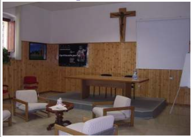
Il Centro di accoglienza "Città di Sassari"

Il desiderio di credere nell'Uomo e nella possibilità di una sua rinascita attraverso l'amore e la solidarietà, sono le motivazioni che, ormai da moltissimi anni, mi portano ad essere presente nella realtà che rappresenta il Centro di accoglienza di Sassari. Una realtà fatta principalmente di sofferenza, di storie tristi, apparentemente senza nessuna via di uscita. Storie di uomini e donne, delle loro famiglie, distrutti e abbruttiti in una battaglia dove il nemico è subdolo ed invisibile.