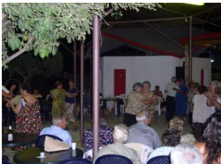
Estate Solidale: un momento della manifestazione conclusiva

Vicini ai bisogni quotidiani, con Estate Solidale