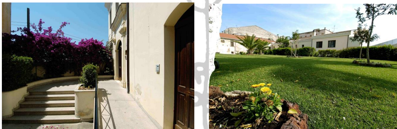
Casa Famiglia per malati di Aids "Sant'Antonio Abate"

Lo screening fatto successivamente a tale evento presso le tre Comunità di Mondo X evidenzia la presenza del 52% di sieropositivi (HIV). Da quel momento Mondo X si è sempre interessato ed ha preso in carico i giovani malati di AIDS, finché nel 1998 crea nel convento di sant'Antonio Abate, ceduto in uso dai frati Minori di Sardegna, la Casa Famiglia Sant'Antonio Abate.