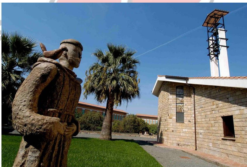
Comunità Terapeutica Residenziale a Campu 'e Luas

Il 7 maggio 1985 viene fondata la Comunità Terapeutica Residenziale a Campu 'e Luas in agro di Uta (CA), con strutture (casa e terreni) messi a disposizione dalla Regione Autonoma della Sardegna.