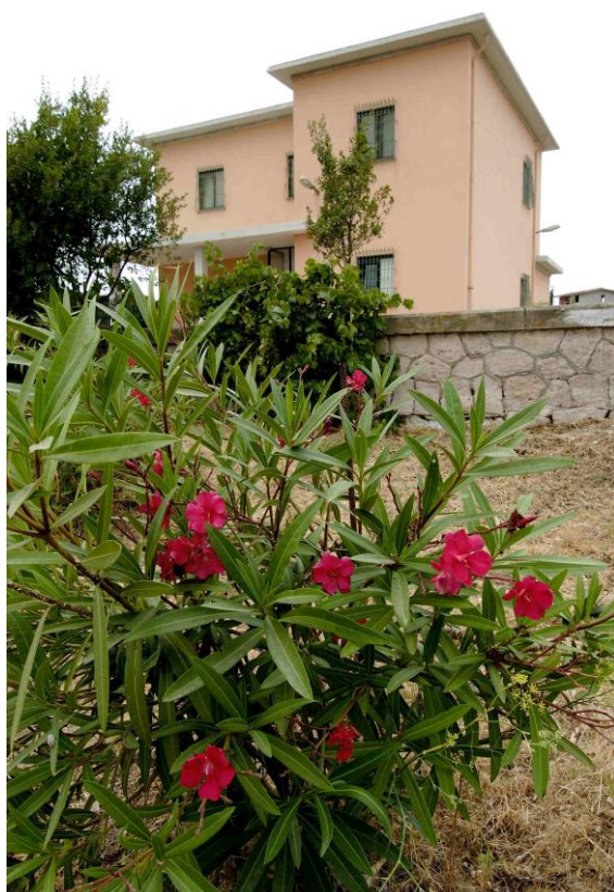
Centro di Formazione di Badesi

Nel 1997 la Regione Sardegna concede in comodato d'uso un fabbricato in Badesi, posta vicino al mare, che viene utilizzata da Mondo X come centro di formazione.