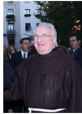
Padre Eligio Gelmini

La sua origine si ricollega a quella lunga e tutt'ora inesaurita ricerca da parte dei francescani italiani sul come condividere la realtà dei nuovi poveri e incidere positivamente sulla loro vita. Specificatamente si ispira ai programmi di padre Eligio Gelmini, frate francescano della Lombardia, fondatore e pioniere in Italia sul fronte della droga e della più variegata emarginazione.