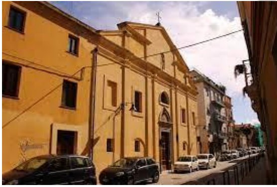
Convento di San Mauro a Cagliari