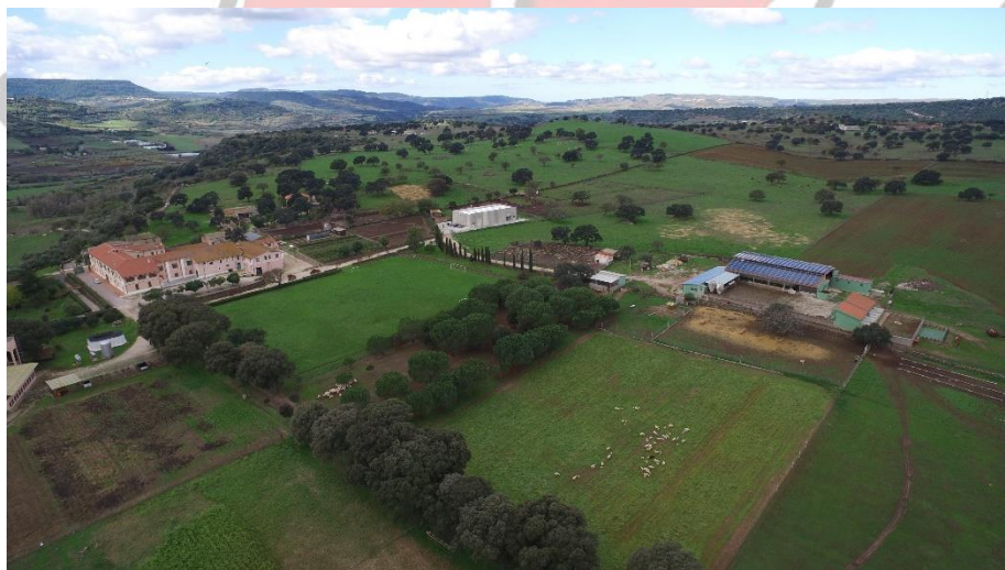
Veduta aerea della Comunità di S'Aspru