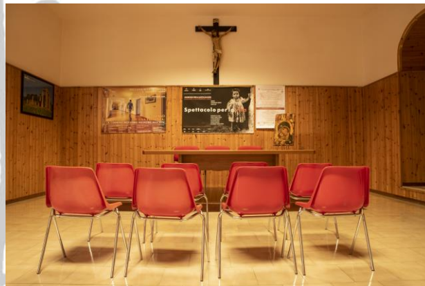
Centro di accoglienza "Città di Sassari"

Nel 1984 i frati e i volontari formalizzano con apposito Statuto la creazione dell'Associazione Mondo X – Sardegna che, acquistando negli anni successivi la personalità giuridica e lo status di Organizzazione Non Lucrativa di Utilità Sociale (ONLUS), diviene l'organismo gestore delle Comunità e di tutto il progetto nato dall'intuizione dei frati sardi.